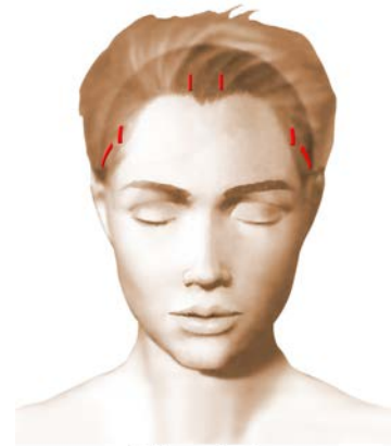
Incisions = cicatrices

Le jour de l'intervention, au moindre doute, un test nicotinique urinaire pourrait vous être demandé et en cas de positivité, l'intervention pourrait être annulée par le chirurgien.