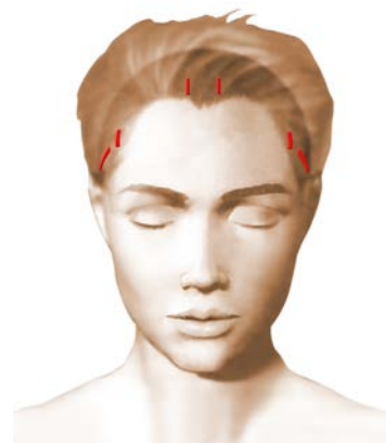
Incisions = cicatrices

Ces incisions permettent le passage de l'endoscope relié à une mini caméra-vidéo et livrent passage aux différents instruments spécifiquement adaptés à cette chirurgie endoscopique.